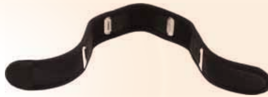
首用 (中タイプ 2枚・小タイプ 2枚) 価格 ¥9,072 (税込)