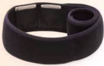
腰用 (大タイプ 2枚) 価格 ¥12,096 (税込)