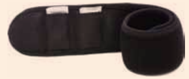
膝用 (中タイプ 2枚) 価格 ¥7,344 (税込)