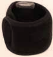
足首・肘用 (中タイプ 1枚) 価格 ¥4,320 (税込)