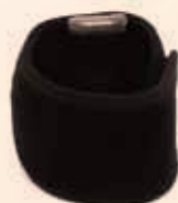
手首用 (中タイプ 1枚) 価格 ¥4,620 (税込)